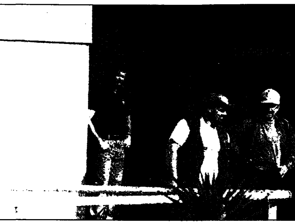
ثلاثة ممثلين امريكيين يشاركون في مؤتمر في بغداد امس في احد المواقع

في وقت سابق من الشهر الجاري، جازت المحكمة العراقية العليا في محكمة الموصل، جناية «لرقيق» على رجلين من جنود الجيش العراقي، وذلك بعد أن ثبتت تورطهما في اغتيال ثلاثة من أعضاء مجلس النواب العراقي، وهم: الدكتور عبد الكريم الجبوري، والدكتور عبد الوهاب الجبوري، والدكتور عبد الوهاب الجبوري.